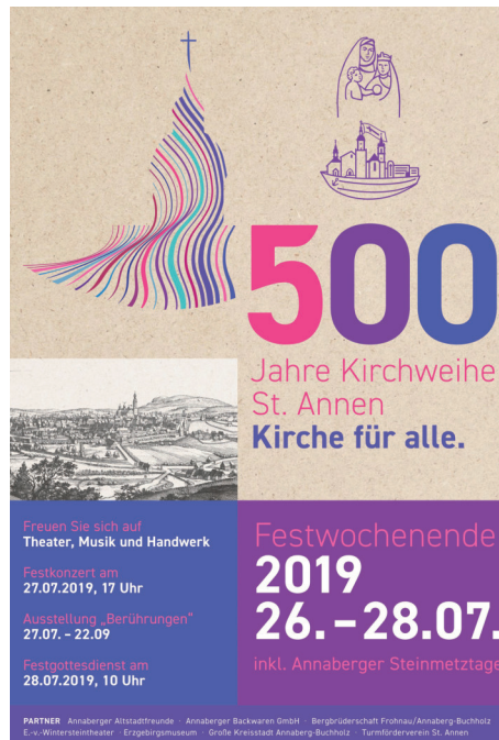
Offizielles Plakat des Jubiläums

Im Rahmen des Festgottesdienstes wird der Auftakt zur „LEGO-Challenge“ gegeben. Mit 130 kg LEGO-Steinen wird dabei in den nächsten Wochen die St. Annenkirche nachgebaut. Täglich während der Öffnungszeiten der Kirche, in der Regel montags bis samstags von 10.00 bis 17.00 Uhr und sonntags von 12.00 bis 17.00 Uhr können sich kleine und große Bauleute an dem ehrgeizigen Vorhaben beteiligen.