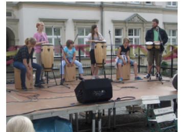
Trommelgruppe - Museumsdreieck